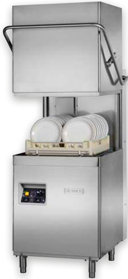
NE 1300 HY-NRG