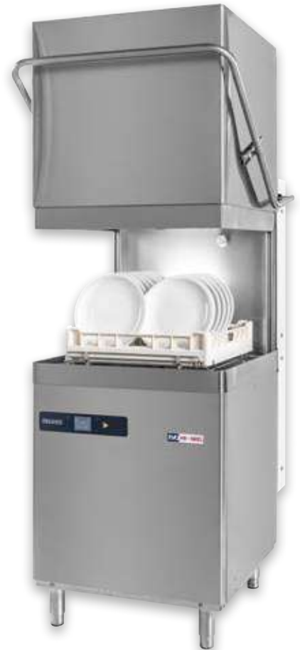
N 1300 S EVO-2