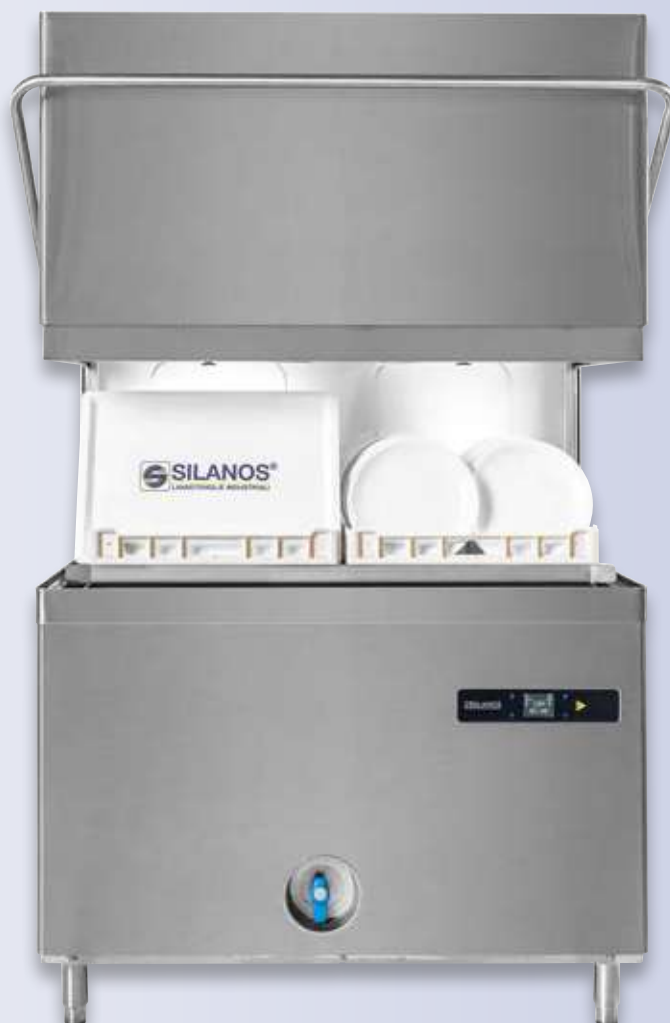
N-1300 Doble Cúpula