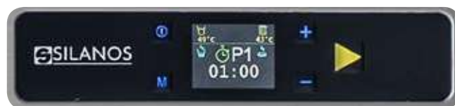
Innovador Panel de Mandos EVO-2