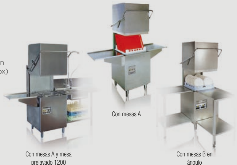
Con mesas A y mesa prelavado 1200

Brazos Lavado y Aclarado en acero inox. Doble filtro en acero inox Cuba estampada, cantos redondeados