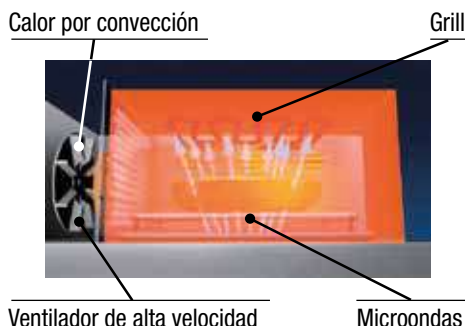
Calor por convección