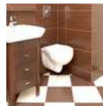
Suelos de baños