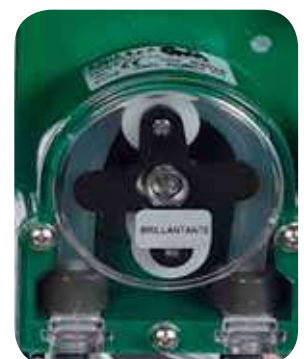
Dosificador de Abrillantador Peristáltico