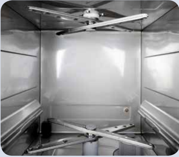
Interior Serie DIGIT

Los lava-vajillas SILANOS son el fruto de 50 años de experiencia en la fabricación de lava-vajillas. Máquinas potentes y robustas, fabricadas desde la misma lámina de acero inox. y con componentes de primera calidad, capaces de resistir a las más duras condiciones de trabajo. Seis modelos de diferentes potencias y producciones, con múltiples mejoras sin incremento de precio: