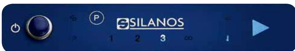
Panel Serie DIGIT